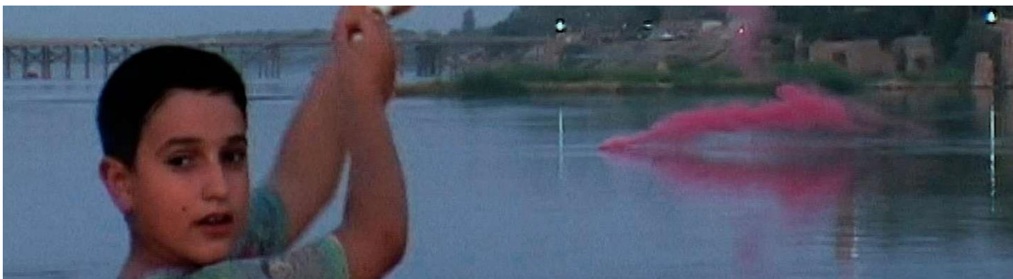
Homeland Irak année 0