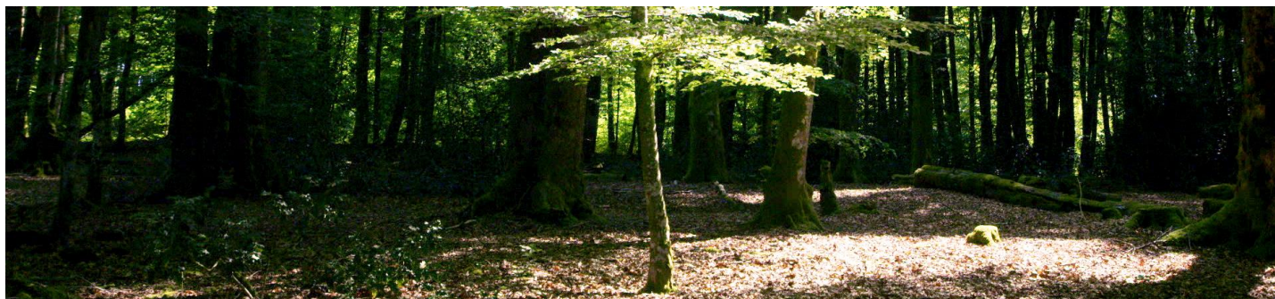
Le Temps des forêts

49 films proposés par la coordination nationale bénéficient d'un numéro de visa. Ils sont à retrouver dans les différents cycles : L'Arbre et la forêt, les 20 ans du Mois du doc, Impact, Parcours de producteurs, Tournées de cinéastes et Acid doc pop.