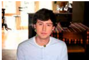
Coming out de Denis Parrot

Certains films par la force de leur regard sur l'environnement, les droits humains et la justice sociale inspirent pour changer le monde. Le Fipadoc les met en lumière sous le label Impact et facilite, avec ses partenaires, leur diffusion tout au long de l'année et sur tout le territoire.