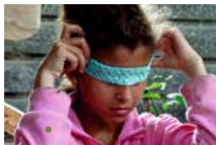
Samouni Road de Stefano Savona