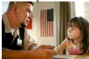
Of Men And War de Laurent Bécue-Renard