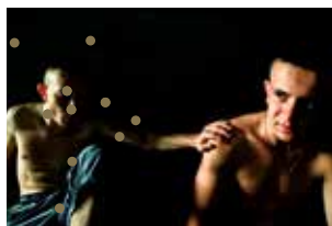
Pas comme des loups de Vincent Pouplard

Présentation et sensibilisation pratique à l'audiodescription via l'écoute comparative d'un même extrait décrit deux fois, suivi d'une "mise à l'épreuve" du public. Prévoir un carnet, un stylo et réviser ses cours de dessin!