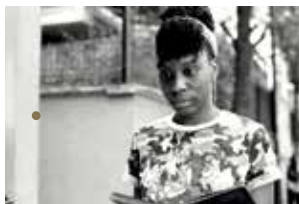
Nos défaites de Jean-Gabriel Périot

— Une exposition itinérante autour des séquences animées par Simone Massi issues du dernier film de Stefano Savona Samouni Road est proposée par la Galerie Miyu.