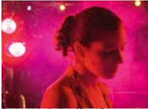
Ce cher mois d'août de Miguel Gomes