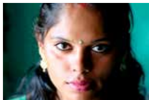
Guru, une famille hijra de L. Colson, A. Le Dauphin