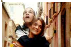
En Construcción de José Luis Guerín

Où comment recréer de l'architecture avec de l'architecture existante : remettre en état, réorganiser et/ou accueillir de nouveaux usages, améliorer le confort et les performances énergétiques ; globalement, requalifier un bâtiment ou un ensemble.