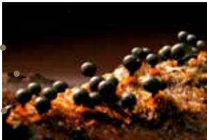
Planète Z de Momoko Seto