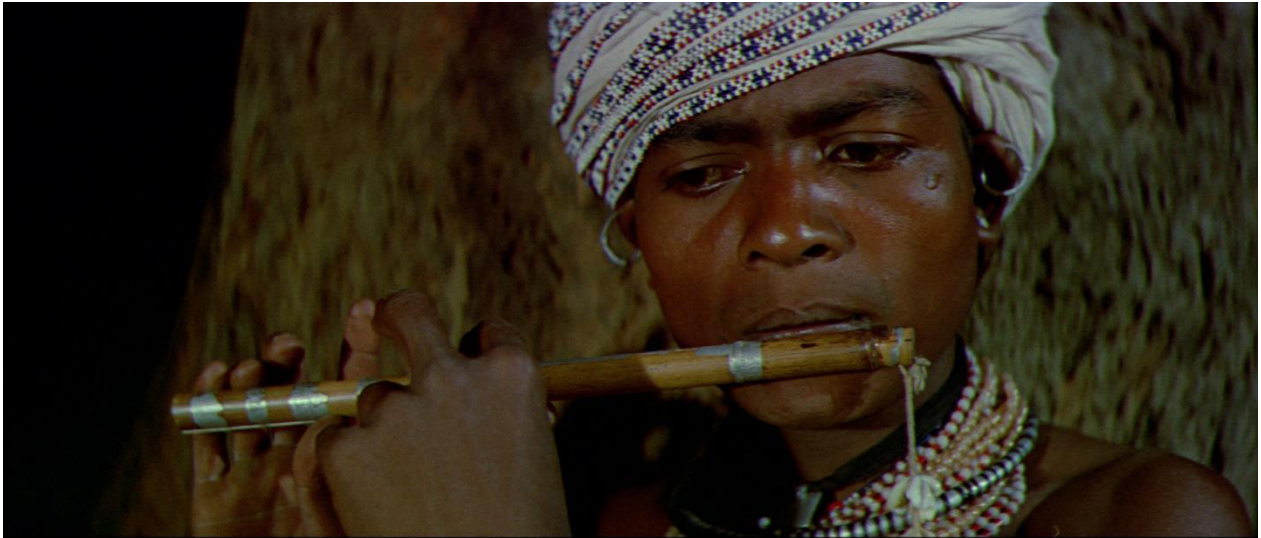
La Grand Aventure de Arne Sucksdorff

Le Mois du doc peut être l'occasion de faire découvrir le documentaire aux jeunes. Cette sélection de films peut vous y aider. Des ateliers pratiques sont proposés en complément, et pourront faire l'objet d'un soutien financier de la part de CINA.