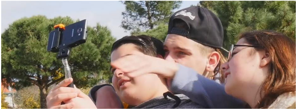
Atelier de réalisation de l'association lddb